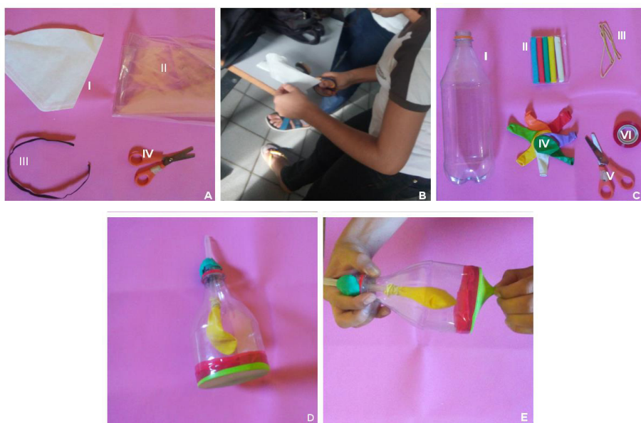
Figura 3 - Materiais utilizados no experimento.