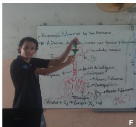
Figura 4 - Aula expositiva com utilização do material confeccionado.